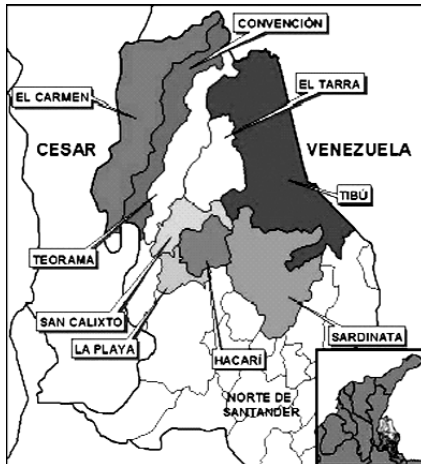
División político-administrativa del Catatumbo

Según el Programa Mundial de Alimentos, PMA, más del 48% de su población presenta desnutrición global, uno de los índices más altos del país, y gran parte de las familias sólo consumen yuca y plátano. 6