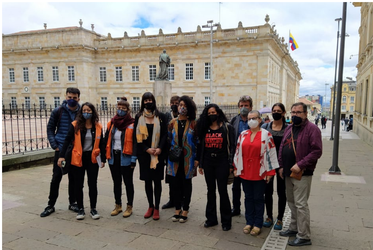
Delegació catalana al costat de la plaça Bolívar de Bogotà

L'informe pretén dirigir-se especialment a les institucions catalanes, espanyoles i europees perquè revisin les seves relacions amb el Govern