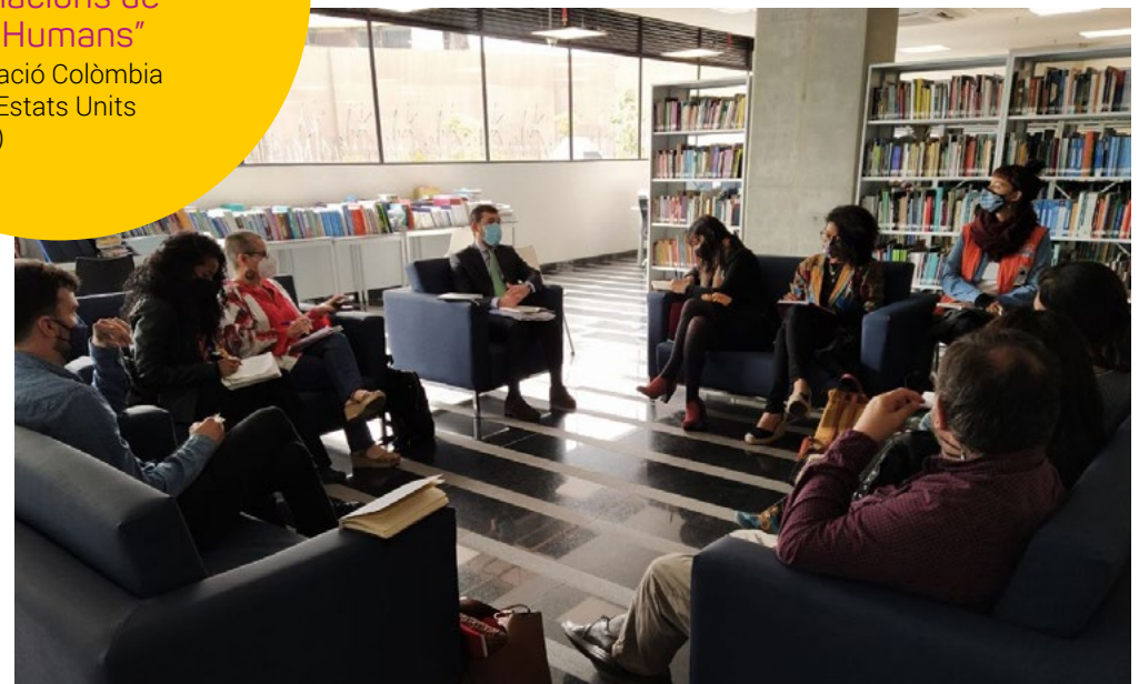
Reunió de la Delegació catalana con la Defensoría del Pueblo

Coordinació Colòmbia Europa Estats Units (CCEEU)