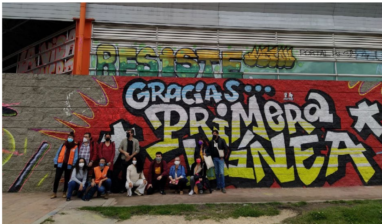
Delegació catalana en el Portal de las Américas o Portal de la Resistència de Bogotà

El decret 575 es va expedir el 28 de maig, el mateix dia en què es va complir un mes de les mobilitzacions i en què van ser convocades diferents accions en diverses ciutats del país, en una jornada en la qual va haver-hi enfrontaments entre la Força Pública i els manifestants. Cali va ser una de les ciutats més afectades pels fets violents i allà es van reportar 13 morts en el marc de les protestes. Posteriorment, el 24 de juliol, el Consell d'Estat va suspendre transitòriament el decret 575 en considerar que estava posant en risc l'exercici del dret a la protesta social.