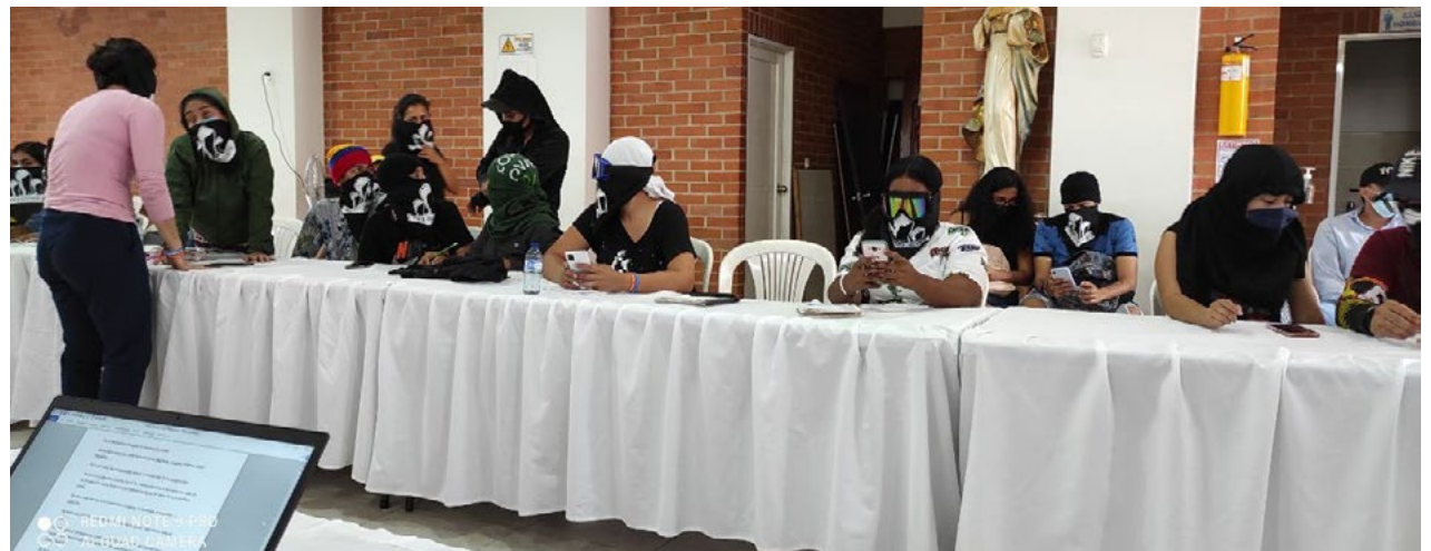
Reunió de la Delegació amb la Unió de Resistències Cali