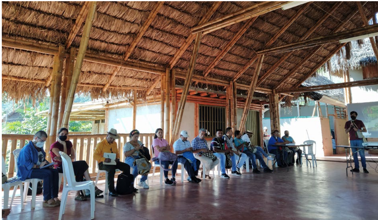
Reunió de la Delegació amb el Consell Regional Indígena del Cauca (CRIC) a Santander de Quilichao

ganitzacions i centrat en Cali, subratlla la “violència policial i racisme sistèmic” contra les comunitats i, en el cas del Paro, contra els joves especialment, fins al punt que s'ha començat a utilitzar el terme d’“afrojuenicidi”, en una mobilització que consideren que ha tingut un “tracte de guerra” per part de l'Estat.