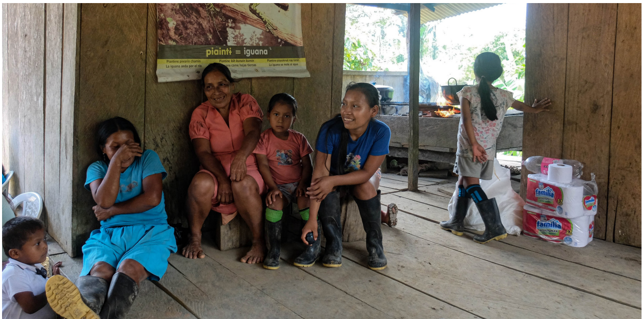
"Resguardo Cuasambi" Enero 2022.

Ecopetrol al imponer el OTA afectó las formas de organización y relacionamiento del pueblo awá por no respetar la toma de decisiones ni los espacios de autogobierno del pueblo en 1969 ni en 2005 cuando Ecopetrol presentó el Plan de Manejo Ambiental al ANLA sin consultarlos. Luego con la presencia de las Farc-ep y la imposición de sus normas la Columna Móvil Daniel Aldana y el Frente 29 afectaron los liderazgos y debilitaron las estructuras político-organizativas propias de los awá al no respetar su autonomía territorial y contaminar su Casa Grande volando los oleoductos y permitiendo la instalación de válvulas funcionales al narco. Hoy, las disidencias y otros grupos armados ocasionan el debilitamiento de espacios de autogobierno al amenazar y desplazar a los líderes que se oponen a las válvulas y laboratorios de drogas, lo que a su vez ha afectado las formas propias de protección comunitaria y control territorial. Ecopetrol y los actores armados han irrespetado las autoridades tradicionales awá lo que constituye un daño a la autonomía e integridad política y organizativa [Decreto 4633 DE 2011, art.46] y, por otra parte, cuando autoridades o familias se desplazan por oponerse al oleoducto se produce un daño con efectos colectivos porque pone en peligro la persistencia social, cultural, organizativa, política, ancestral y la capacidad de permanencia cultural y pervivencia como pueblo 13 .