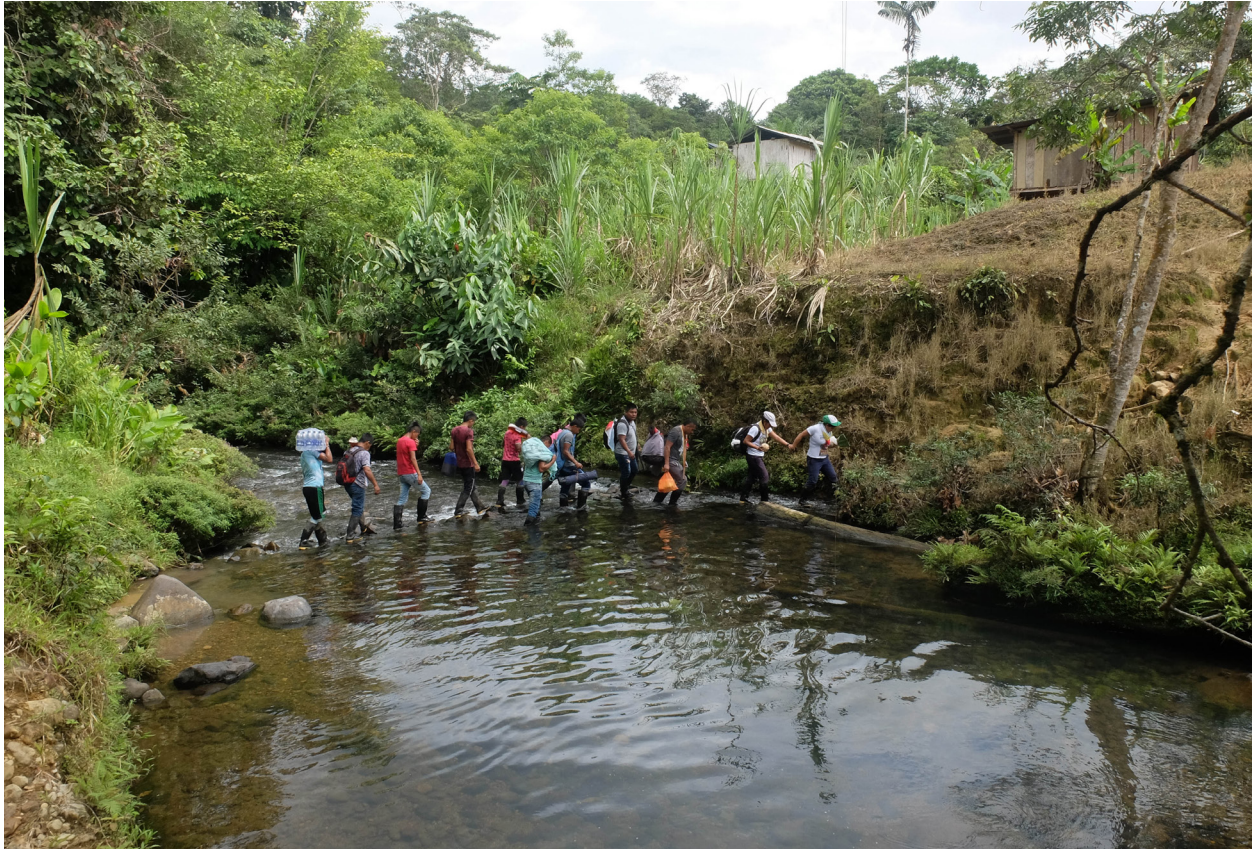
“Resguardo Cuasambi” Enero 2022.