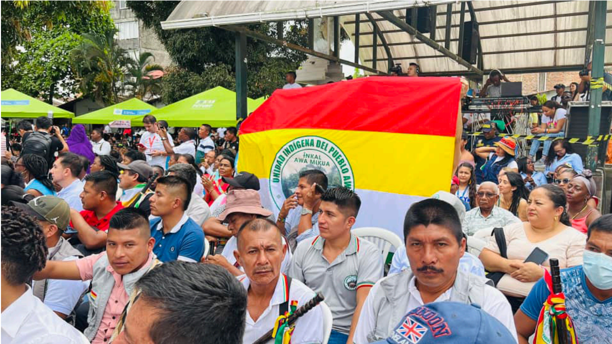
“La Unipa ha participado en numerosos espacios de concertación con el gobierno colombiano para la exigencia de derechos. El pasado 3 de Noviembre de 2022 participaron en los diálogos Regionales en la ciudad de Tumaco”.