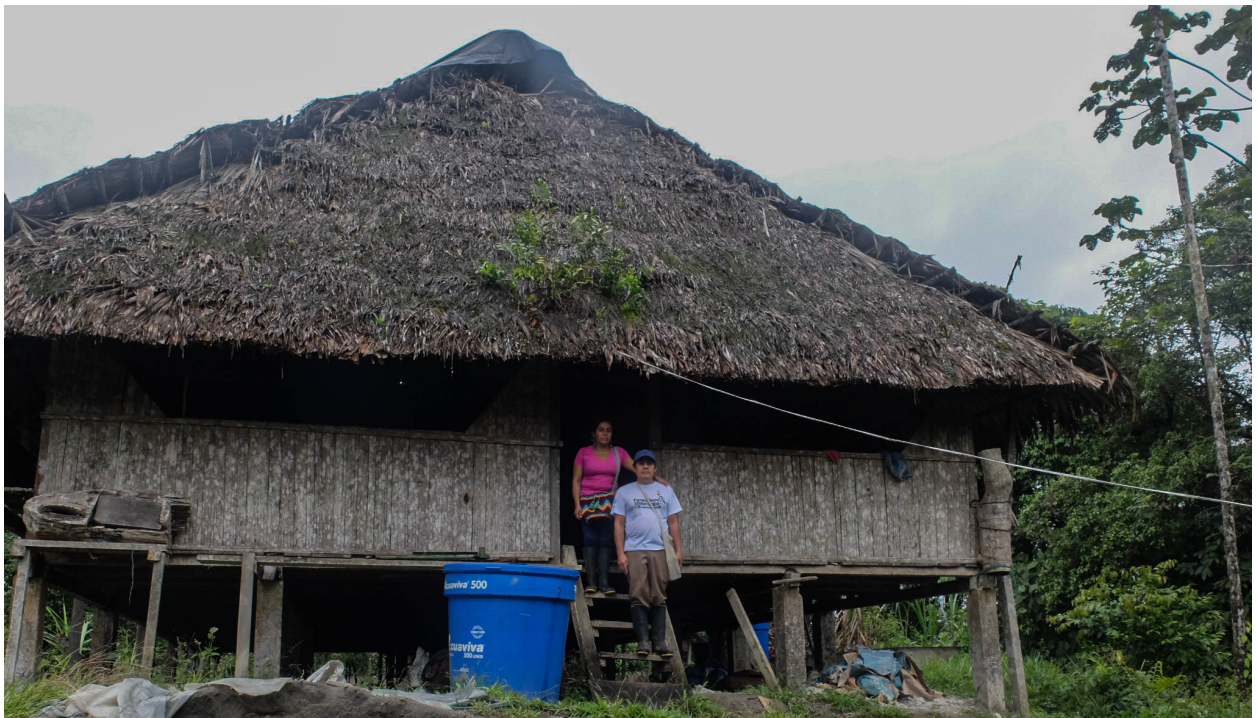
"Casa de la sabiduría". Enero 2022.

Nosotras siempre hemos pensado, siempre hemos mirado que el camino está en seguir fortaleciéndonos en esta parte productiva, en la parte de iniciativas, en la creación de asociaciones, en la siembra de los productos y la crianza de nuestros animales; y en la creación, también, de unas empresas, de unas microempresas. Soñamos algún día poder exportar, comercializar nuestros productos; pero ha sido muy difícil y no sabemos hasta cuándo va a ser tan complicado, porque no contamos con las medidas. Acá hay muchos territorios donde se ha sembrado la yuca, se ha sembrado Chiro (variedad de banano enano dulce), el plátano, pero no están valorizados. Lo compran muy barato y ni siquiera hay cómo llevarlo a vender a otra parte, no hay un transporte. Los que lo piden, lo piden es que sea escogido. Entonces, en muchas comunidades ha tocado, que eso que se ha sembrado con tanto esfuerzo, dárselo a las gallinas, botarlo, y hasta ni comérselo uno, porque uno come una parte y lo demás tiene que pudrirse ahí. Y entonces qué vamos a hacer así, no comercializamos, nadie nos compra, no tenemos en que venderlo, ni un transporte. [Y.López, entrevista, 2022]