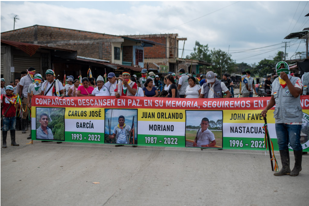
"Minga Humanitaria por la vida y la memoria en respuesta a la masacre de Julio 2022". Julio 2022.