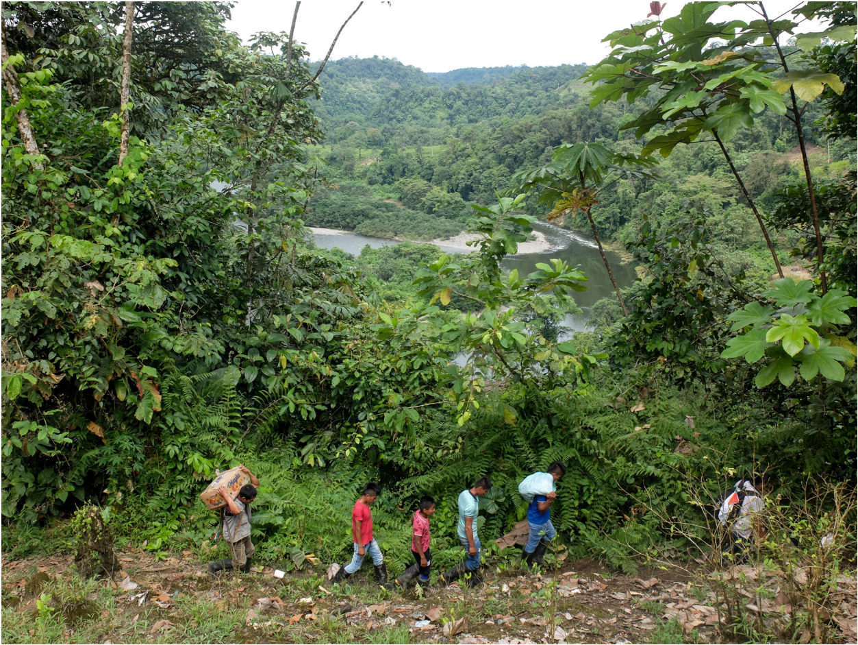
"Resguardo Cuasambi" Enero 2022.