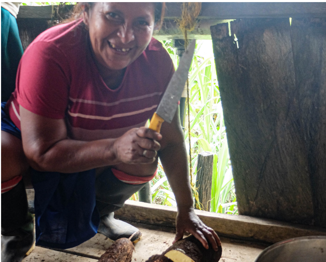
“Mujer pelando yuca de cosecha propia en el Resguardo Cuasambi”. Enero 2022.

La contaminación ambiental está causando enfermedades y desplazamientos lo que beneficia a los narcotraficantes que se están apropiando del territorio awá y expandiendo el monocultivo de coca y aumentando la instalación de válvulas, mangueras y piscinas, situación que afecta la pervivencia del pueblo awá y el delicado ecosistema del pacífico nariñense.